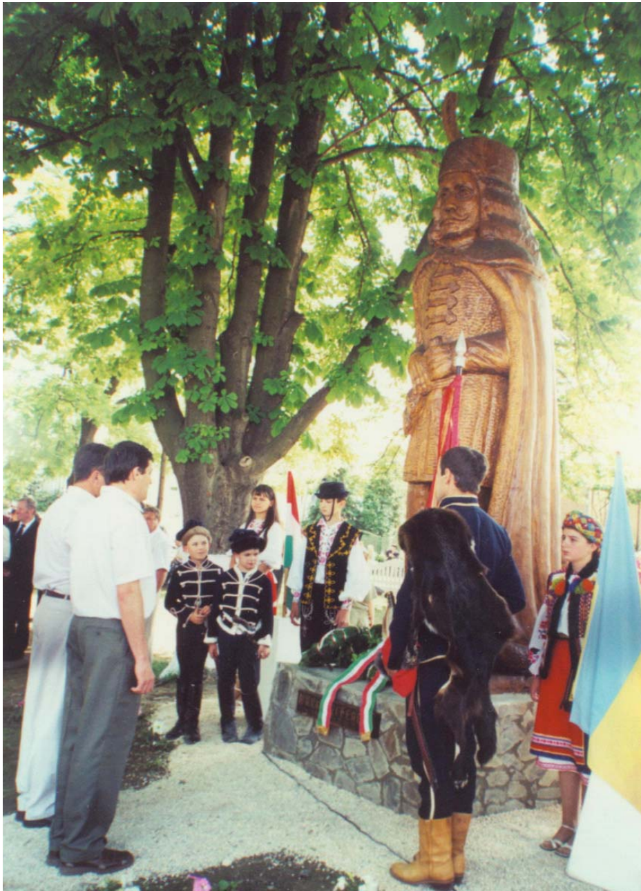
16. kép. A salánki Rákóczi-szobor felavatása